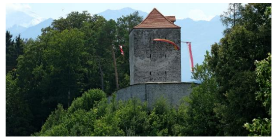
u zum Strättligturm