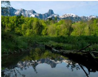
Am Glütschbach na

Wandern T1, leicht 124m 139 m → 12 km | ca. 3h