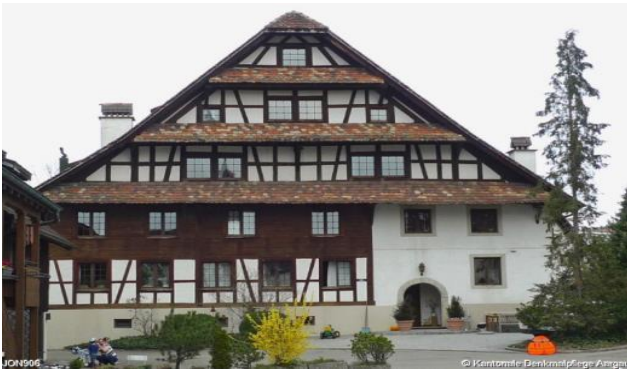
Alte Mühle in Jonen